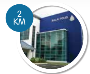
BALAI POLIS SEBERANG JAYA