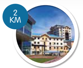
UTM PERMATANG PAUH