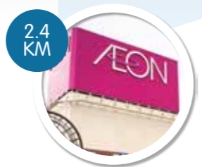
PASARAYA AEON BIG