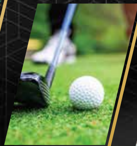
Padang Sasar Golf