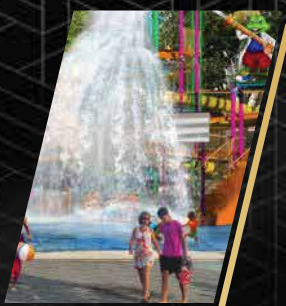
Taman Permainan Air