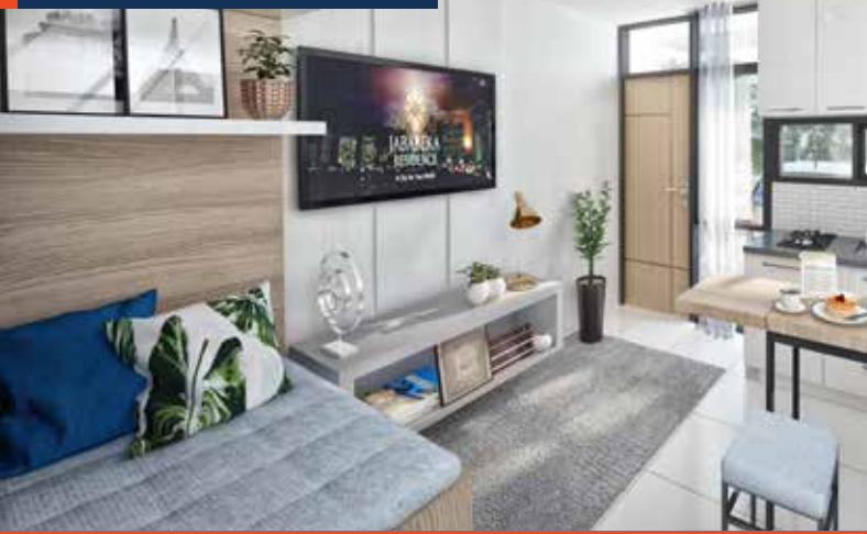
Ruang Keluarga Tipe 36/30