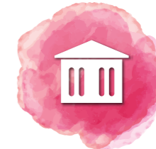
DEWAN SERBA GUNA